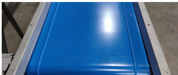
Couloirs à déchets extérieurs